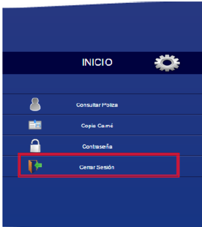
Fig. 6 Cierre de Sesión Asegurado

La función Cerrar sesión finaliza la actual sesión de consulta (log out), para poder acceder nuevamente, se deben ingresar los datos de acceso (Usuario y Contraseña).